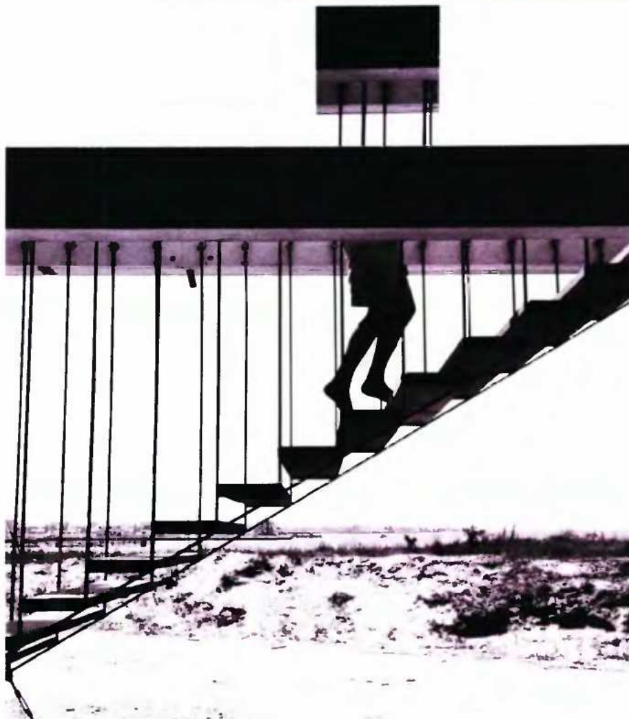
André Kertész © Ministère de la culture. Η Εξοχή, 1955