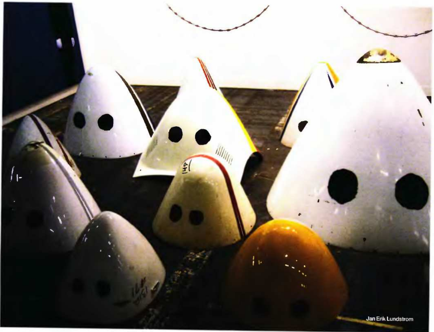
Jan Erik Lundstrom

φυλακή, ο οίκος ανοχής, το σχολείο, το γυμναστήριο κ.α. Οι προσκεκλημένοι καλλιτέχνες, ξεπερνώντας τις παραμέτρους της εθνικότητας, της ταυτότητας ή την επιβολή ενός ειδικού εκφραστικού μέσου, προσκαλούνται να ερμηνεύσουν εκ νέου την έννοια της ετεροτοπίας μέσα από έργα-κλειδιά, τα οποία προσκαλούν όλες τις αισθήσεις του θεατή, καθώς λειτουργούν διαδραστικά. Προσεγγίζουν πολυδιάστατα τις «άλλες» ετεροτοπίες, όπως το Διαδίκτυο, την εικονική πραγματικότητα, τις νέες τεχνολογίες, το ξεπέρασμα του Μουσειακού χώρου, αυτού του λευκού θεομοθετημένου κίβου που αποτελεί επίσης μια ετεροτοπία, όπως και τον επαναπροσδιορισμό της σχέσης του κέντρου με την περιφέρεια. Η Διευθύντρια του Κρατικού Μουσείου Σύγχρονης Τέχνης, Μαρία Τσαντσάνογλου, μια από τις επιμελήτριες της Μπιενάλε, προσκάλεσε το Γιαν Έρικ Λούνστορμ (Διευθυντή του BildMuseum Σύγχρονης Τέχνης του Πανεπιστημίου της Umea στη Σουηδία) και τη γλωσσολόγο και ιστορικό τέχνης Κάριν Νταβίντ, η οποία ανάμεσα σε άλλες σημαντικές διευθυντικές θέσεις, υπήρξε καλλιτεχνική διευθύντρια της διάσημης εικαστικής διοργάνωσης «Documenta X» στο Κασέλ της Γερμανίας. Στις τρεις επιμέρους ενότητες, κάθε επιμελητής αναλαμβάνει την επιλογή καλλιτεχνών από διαφορετικές γεωγραφικές περιοχές. Ο Γιαν Έρικ Λούνστορμ προτείνει καλλιτέχνες από τις χώρες της Αφρικής και της Λατινικής Αμερικής, η Καρίν Νταβίντ από τις Αραβικές χώρες και η Μαρία Τσαντσάνογλου από χώρες της Κεντρικής Ασίας και της πρώην Σοβιετικής Ένωσης.