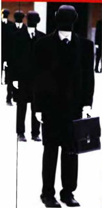
1η Biennale Θεσσαλονίκης