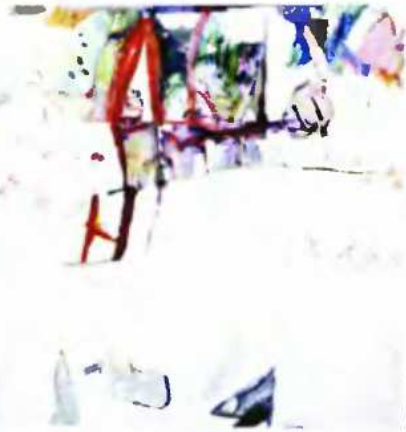
Μαρία Γρηγοριάδη, Fotis Art Café