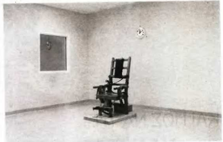
Λουσίνα Ντέβλιν, Ηλεκτρική καρέκλα, Συμφωνιστικό Κατάστημα Γκράνφιλντ, Βιρτζίνια 1991, συγγραφική παραχώρηση Galerie m Bochum.

*"Ένας τόπος χωρίς τόπο" & "Μυστικοί κήποι" έως τις 20 Αυγούστου 2007 Μουσείο Φωτογραφίας Θεσσαλονίκης (πρώτη προβολή - ΟΛΘ) Τρίτη έως Παρασκευή από 11 π.μ. έως 7 μ.μ. Σάββατο και Κυριακή από 11 π.μ. έως 9 μ.μ. Δευτέρα κλειστά